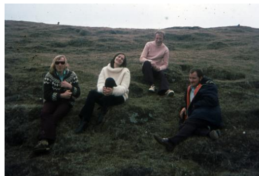
Kannast einhver við þetta fólk?

Rangæingar og Skaftfellingar halda áfram að spila framsóknarvist í Skaftfellingabúð annað hvert fimmtudagskvöld kl. 20. 12. janúar – 26. janúar – 9. febrúar