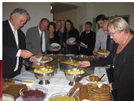
Vigfús Þormar og hans fólk var nokkuð sáttt með fýlinn