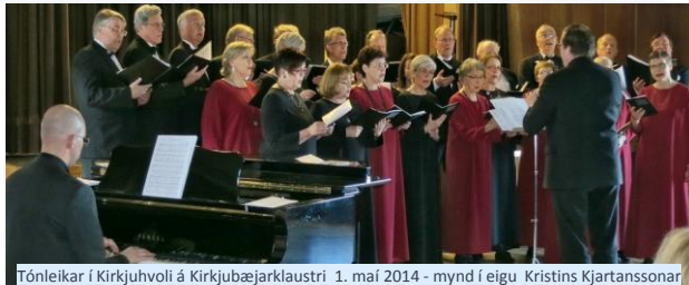
Tónleikar í Kirkjuholi á Kirkjubæjarklaustri 1. maí 2014

Framundan er Skaftfellingamessa 15. mars í Breiðholtskirkju og er stefnt á tónleikaferð 1. maí. Vortónleikarnir verða í Seltjarnarneskirkju sunnudaginn 10. maí, kl. 14.