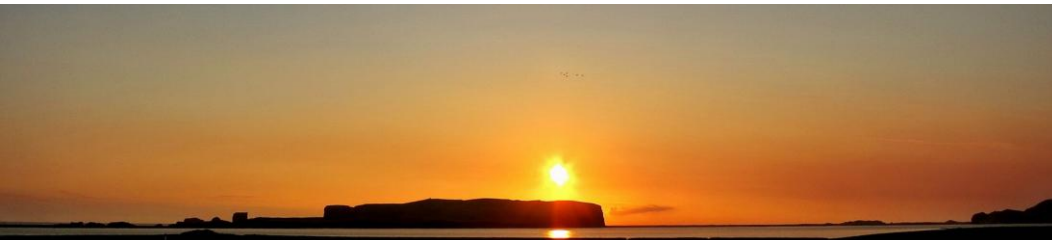
Dyrhólaey á haustsýðdegi 2014